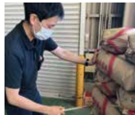
ライスセンターでキヌヒカリの検査を行う検査員

管内ではまだまだお米の収穫が続きます。10月は、5日よりライスセンターを稼働し、ヒノヒカリおよび特栽ヒノヒカリ（花美人）の荷受を行います。ライスセンターをご利用いただく組合員の方は、搬入前のご予約を忘れずにお願いたします。また、ライスセンターへの出荷および個体出荷には、栽培履歴の記帳と提出が必要です。未提出の方は出荷までに栽培日誌の提出をお願いいたします。