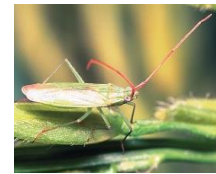
アカヒゲホソドリカスミカメ

発行 : NOSAIひょうご東播磨事務所 調査協力 : JA全農兵庫 支援 : 東播磨農業改良普及事業協議会(構成員: 明石市、加古川市、高砂市、稲美町、播磨町、JAあかし、JA兵庫南、JA加古川南、加古川農業改良普及センター) お問合せ先 : 加古川農業改良普及センター 地域課 電話(079)421-9354 あかし農業協同組合 本店 経済課 電話(078)934-5800