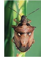
オオトゲシラホシカメムシ