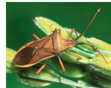
ホソハリカメムシ