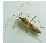
クモヘリカメムシ