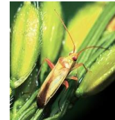
アカスジカスミカメ